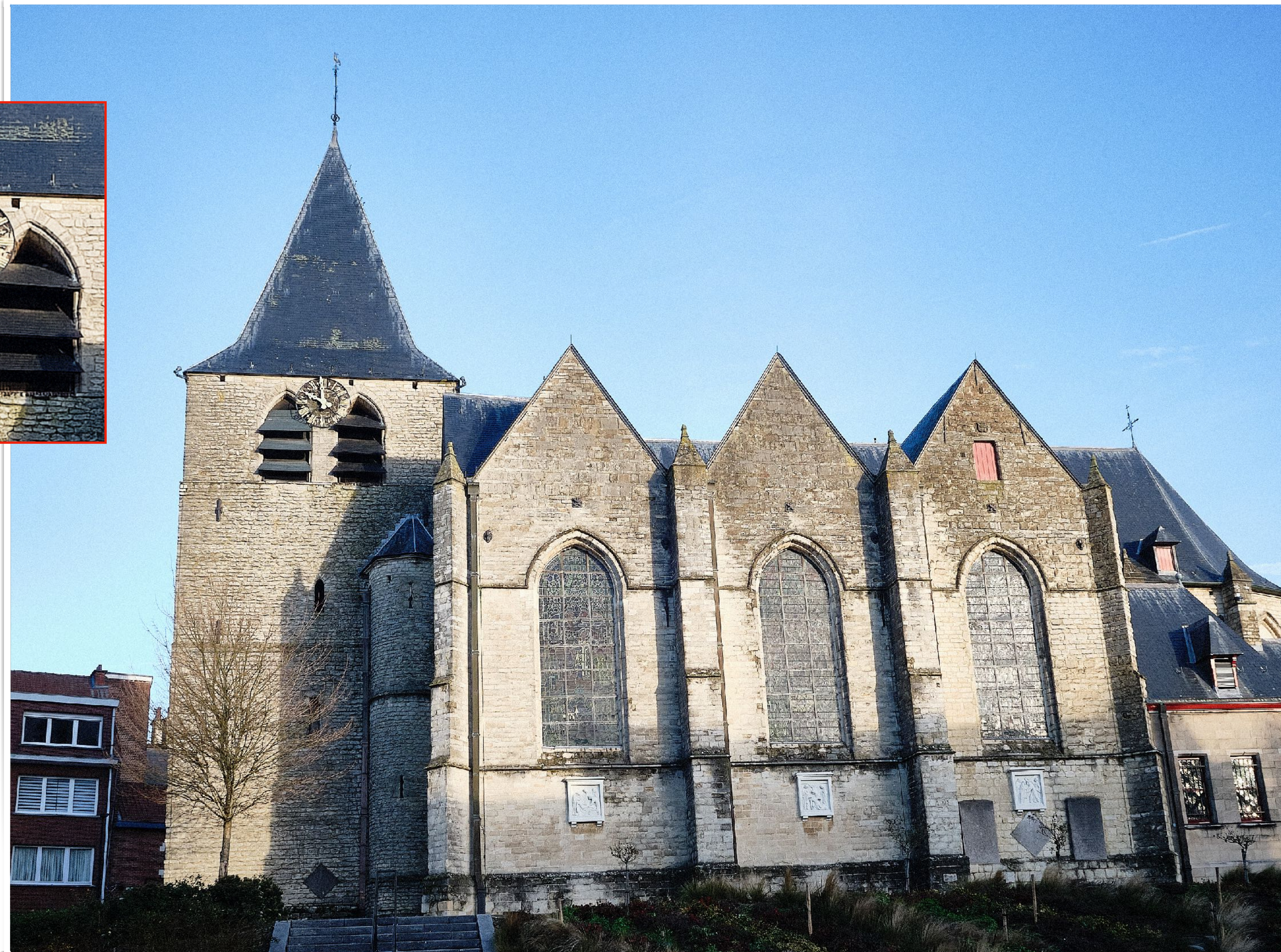
Erfgoed Wemmel: Parochiekerk Sint-Servatius